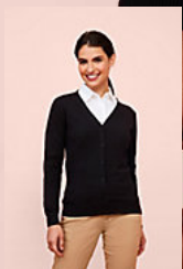
SOL'S GOLDEN WOMEN 90012