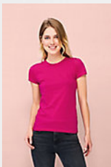
SOL'S MISS 11386