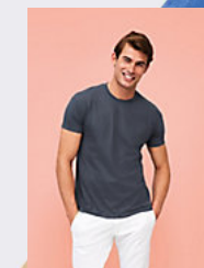
SOL'S REGENT 11380