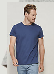
SOL'S CRUSADER MEN 03582