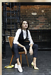
NEOBLU GABIN WOMEN 03163