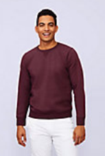
SOL'S SULLY 02990