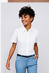
SOL'S ELITE 16030