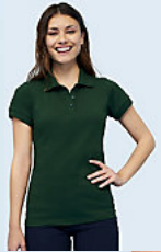
SOL'S PERFECT WOMEN 11347