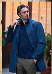
NEOBLU ALFRED MEN 03176